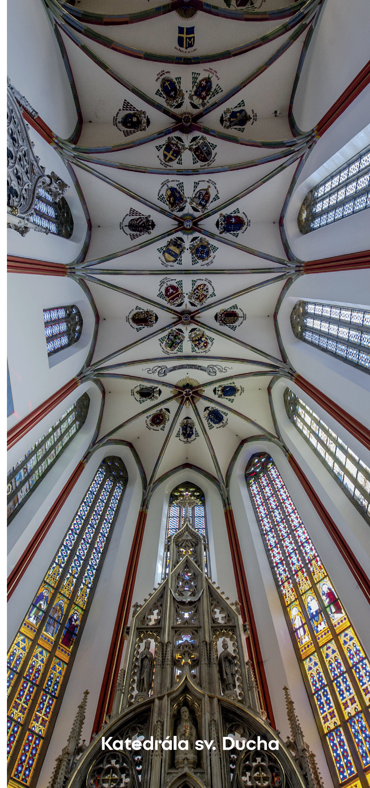
Katedrála sv. Ducha